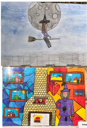
Laboratorio di fumetto sul tema dell'Epifania